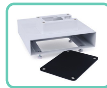
SUPPORTO MINI CPU, SLIM 2.0 ACS-200