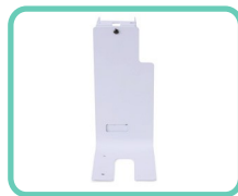
SUPPORTO LATERALE PER SCANNER, SLIM 2.0 ACS-198