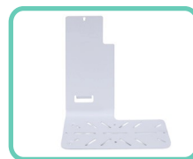
SUPPORTO LATERALE PER SCANNER WIRELESS, SLIM 2.0 ACS-197