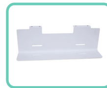
RIPIANO ANTERIORE, SLIM 2.0 ACS-202