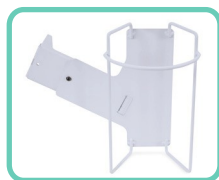
PORTA SALVIETTE A MONTAGGIO LATERALE, SLIM 2.0 ACS-194