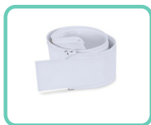
KIT DI COPERTURA DEL CAVO IN VINILE ACS-112