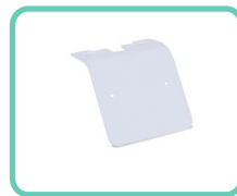
SUPPORTO LATERALE PER STAMPANTE, SLIM 2.0 ACS-199