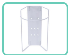
PORTA-SALVIETTE CON SLOT A T ACS-193