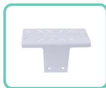
SUPPORTO PER SCANNER E STAMPANTE CON SLOT A T ACS-196